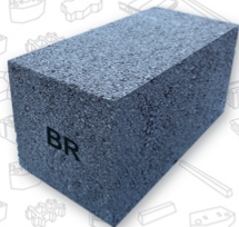
Block Especial / Unidad Solido