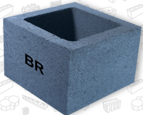
Block Especial / Unidad Columna